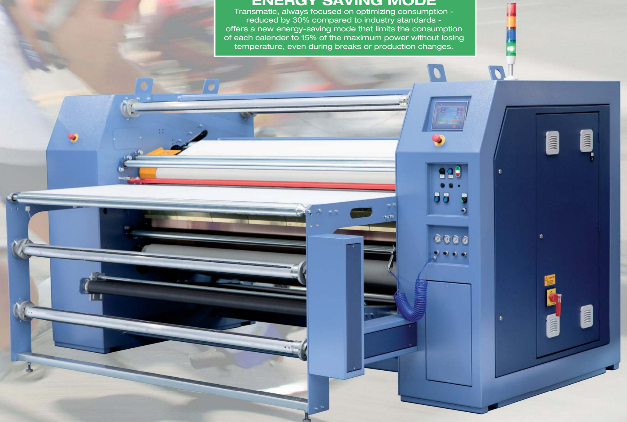
Heat Seal Machines